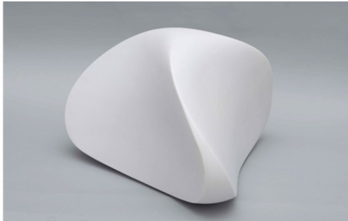
Juan Asensio. Sin título, 2015. 31 x 49 x 12 cm. Mármol blanco de Yugoslavia.